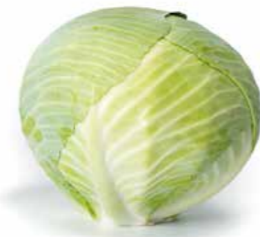
Rijk Zwaan | Noviteti