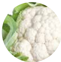
Karfiol Zeleni karfiol