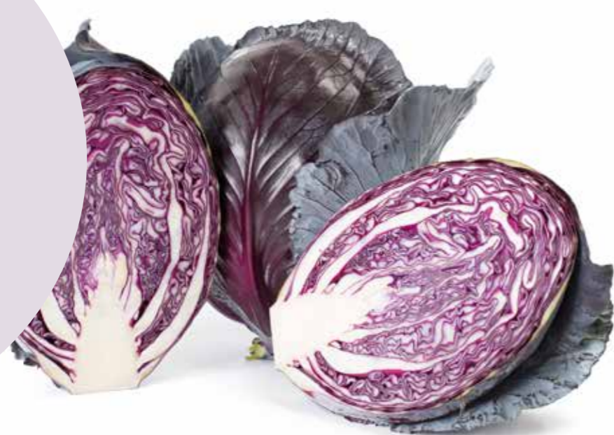
Red Charisma RZ