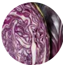
Zeleni kupus Crveni kupus Kelj

zeleni kupus crveni kupus kelj karfiol zeleni karfiol brokoli